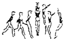
Corrida e salto em extensão com 1/2 volta (5%)