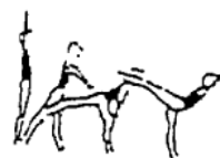
Posição de equilíbrio (avião, bandeira, etc.) (5%)