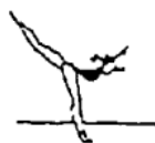
Posição de equilíbrio (5%)